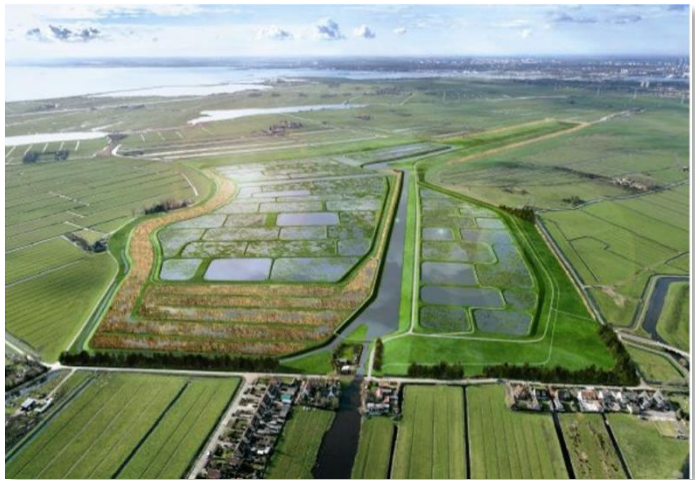
Figuur 1 Volgermeer

Het is onderdeel van het voormalig Nationaal Landschap Laag Holland. De Stelling van Amsterdam ligt aan de noordzijde van het gebied. De snelwegen A7, A8 en A10, de spoorlijn Zaandam-Hoorn, twee hoogspanningstrajecten en het Noord-Hollands Kanaal lopen door het gebied.