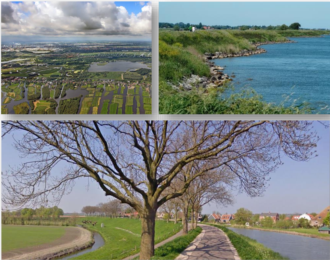
Figuur 4 Rijk aanbod aan landschapstypen

Het aanbod van het gevarieerde landschap en vergezichten, de rijke natuur en verrassende Zuiderzee stadjes,