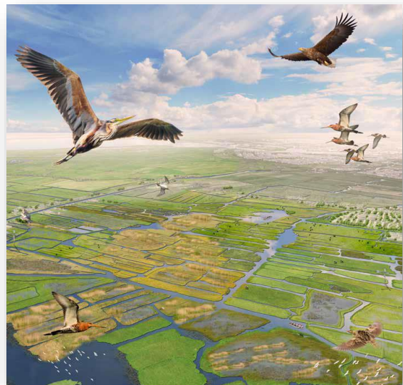
Figuur 5 Topnatuur met ruimte voor de otter, purperreiger, lepelaar, kemphaan en zeearend; en daarmee een onvergetelijke natuurbeleving (Amsterdam Wetlands, Een perspectief voor Laag-Holland in 2050 – d.d. mei 2018)

Het verhaal van Amsterdam Wetlands, en in het verlengde Vitaal Platteland, zorgt voor een goed kader voor de verdere ontwikkeling van de beleving van biodiversiteit, cultuurhistorie en voedselproductie in Twiske-Waterland. De initiatieven bieden ruimte voor nieuwe verbindingen tussen mensen, zoals het bij elkaar brengen van boer en stedeling rond voedselproductie. Maar ook het leren over – en waarderen van – belangrijke cultuurhistorie en natuur. Om Twiske-Waterland toekomstbestendig te maken, kunnen we de vele bestaande kwaliteiten uitbouwen en beleefbaar maken.