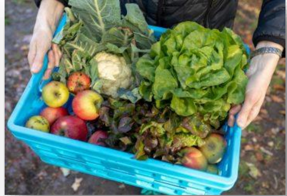
Figuur II Streekproducten

Met landbouw dichtbij wordt bedoeld dat landbouwproductie in de regio (biologisch) plaats vindt en dient als voedselvoorziening voor omliggende dorpen en steden in plaats van de wereldmarkt. Een sterk thema kan zijn dat alle (agrarische) ondernemers in het gebied een duurzaam plan hebben en starten of omschakelen naar circulair produceren en nieuwe teelten, rekening houdend met de opkomende andere waterhuishouding in het gebied. De opkomende behoefte van consumenten is dat voedsel met weinig milieudruk (transport) en dichtbij is geproduceerd. Hieraan gekoppeld zou een gedachte kunnen ontstaan van een lokale markt, waarbij de inwoners van de regio hoofdafnemer worden van het lokaal geteelde voedsel. Meer 'gevoel' en 'verantwoordelijkheid' van de consument bij de productie van ons voedsel en de (schaarse) beschikbare ruimte die we daarvoor nodig hebben.