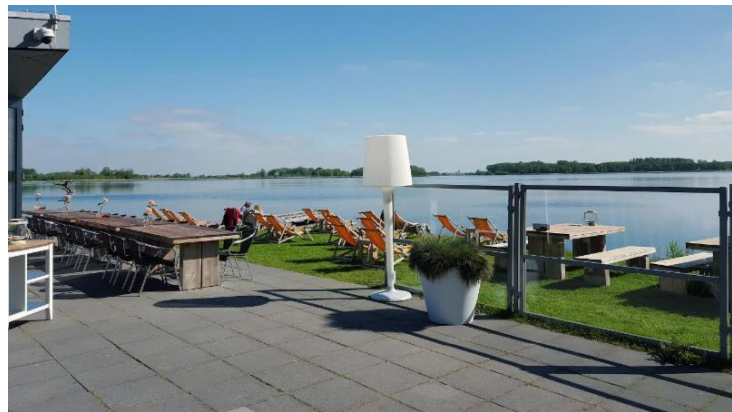
Figuur 3 Terras aan de Stooterplas

Vanwege de nieuwe bestemming werd vanaf 1972 weer volop gegraven in het gebied. De rechte sloten in het zuidelijke deel, indertijd met de hand gegraven, werden met behulp van draglines breder en grilliger gemaakt. Er ontstond een nieuw landschap dat voor een deel lijkt op het landschap uit de tijd dat het gebied nog De Veer heette. Maar de vegetatie uit het verleden is niet meer terug te halen, aangezien het oorspronkelijke veenoppervlak door ontginning en het storten van zand en bagger is verdwenen.