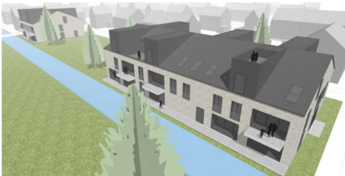
Artist impression van het bouwplan

De locatie ligt in het noordelijk deel van deelplan 7 aan de subsloot, in een centrale groene ruimte. Deze ruimte vormt een bijzondere plek in de buurt, een parkachtig ensemble. De appartementengebouwen versterken met hun ontwerp het bijzondere karakter van deze plek in de buurt. De gebouwen zijn in volume, architectuur en materialisatie onderscheidend ten opzichte van de omgeving. Het perceel is langgerekt en biedt plaats aan twee bouwblokken met respectievelijk 6 en 12 appartementen en een parkeerterrein voor 22 parkeerplaatsen. De rest van het perceel krijgt een groene inrichting.