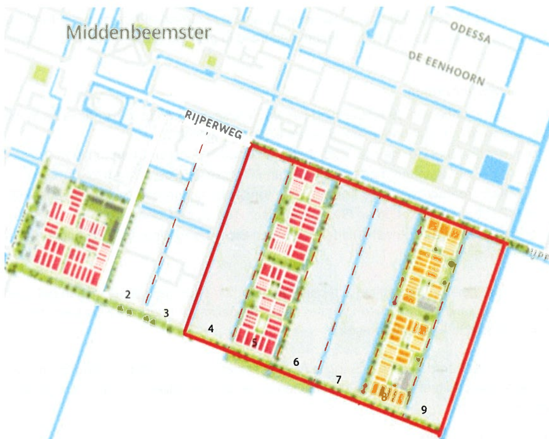
Afbeelding 1: Plankaart deelplannen 'de Keyser II' (rood omkaderd)

Onderwerp: Plan van Aanpak realisatie Integraal Kind Centrum plan De Keyser Middenbeemster