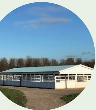
Opening Pannenkoek De Appel.

Rietgrasland gemaaid en opslag in riet verwijderd. Door verjonging van delen van het riet blijft dit gebied geschikt voor de Natura 2000 doelsoorten zoals Roerdomp en Bruine Kiekendief.