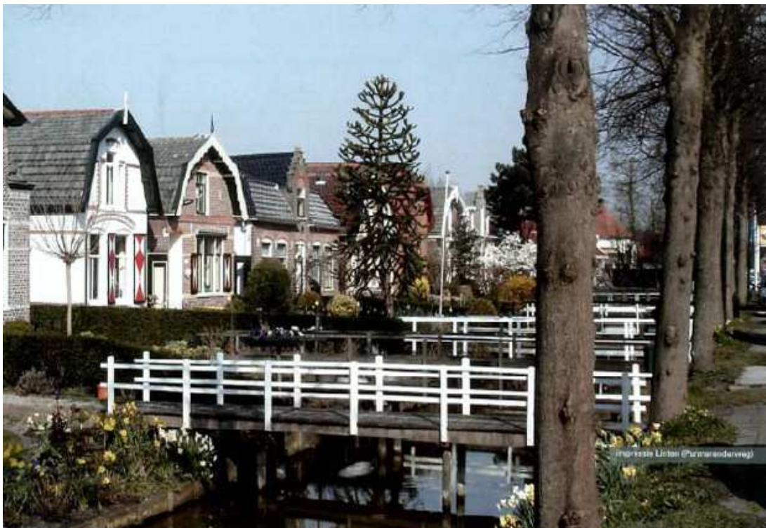
Figuur 3.1 Impressie lintbebouwing (Purmerenderweg)

In figuur 3.1 is een impressie van de inrichting van lintbebouwing weergegeven.