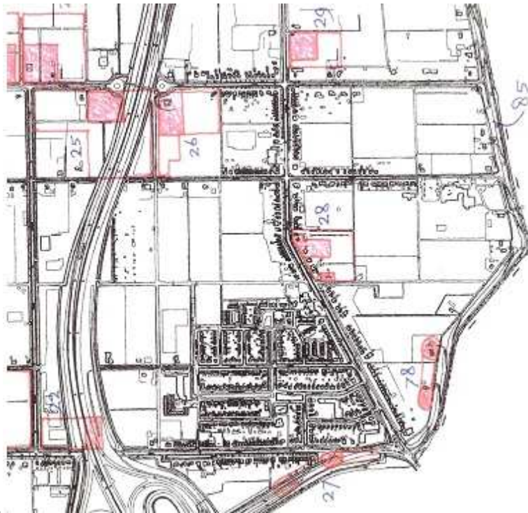
Figuur 4.1: Uitsnede kaart gemeentelijke archeologienota

In de archeologienota is een archeologieregime opgenomen voor het “overig gebied”. Dit archeologieregime is door een besluit van de gemeenteraad d.d. 28 juni 2008 niet van toepassing verklaard omdat er een lage trefkans is op archeologische vondsten in het “overig gebied”. Voor gronden van het onderhavige plangebied is dan ook geen archeologieregime van toepassing en is geen archeologisch onderzoek nodig.