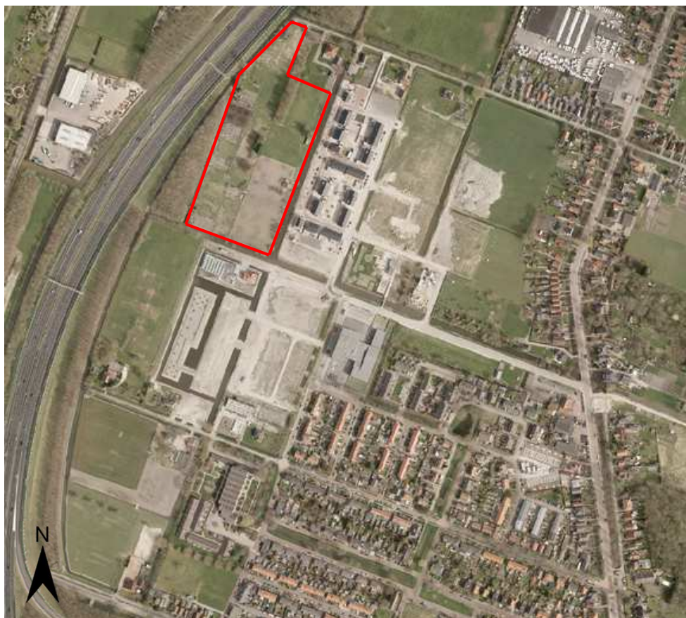
Figuur 1.1: Ligging plangebied

Het plangebied ligt ten noordwesten van de kern Zuidoostbeemster, in de gemeente Beemster (zie figuur 1.1). Het plangebied wordt aan de noordzijde begrensd door het Noorderpad, aan de zuidzijde door het Middenpad en aan de westzijde door de A7 en naastgelegen groengebied. Aan de oostzijde staan de 42 gebouwde woningen in het plan De Nieuwe Tuinderij.