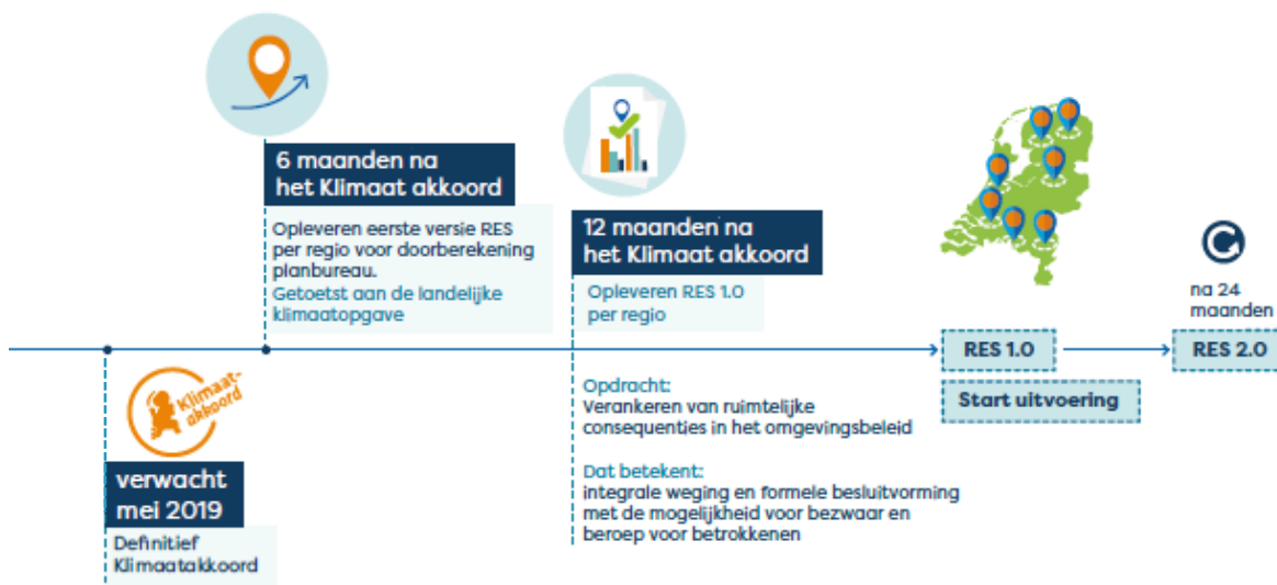
Figuur 2: Planning Klimaatakkoord en RES

Om snel te kunnen starten na ondertekening van het Klimaatakkoord en daardoor de 6 maanden goed te kunnen benutten, kiest regio 4 Noord-Holland Zuid er voor om de besluitvorming van de startnotitie los te koppelen van de ondertekening van het Klimaatakkoord en voor te leggen aan de gemeenteraden, Provinciale Staten PNH en het Algemeen Bestuur van HHNK, Rijnland en AGV (Waternet).