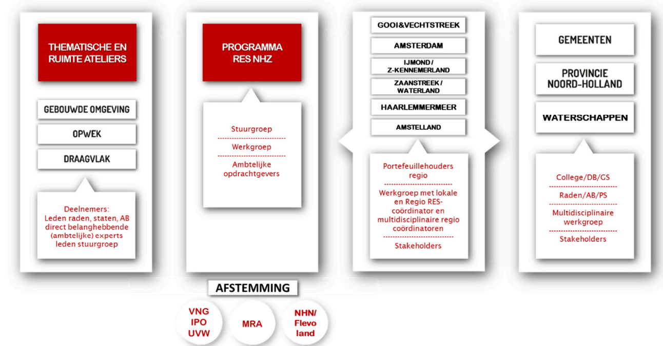
Figuur 3: Werkstructuur Regionale Energie Strategie Noord-Holland Zuid

De input voor de RES wordt opgehaald bij de gemeenten. Deze input wordt, tezamen met de inbreng van de provincie en de waterschappen op deelregio niveau samengebracht tot oplossingen en keuzes die worden opgenomen in de RES NHZ.