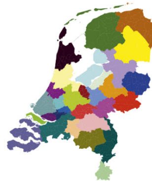
Figuur 1: Indeling energie-regio's

Voor het uitwerken en realiseren van de nationale doelen en afspraken is regionaal en lokaal maatwerk nodig. Het vraagt om nieuwe manieren van intensieve samenwerking tussen overheden, netwerkbeheerders, inwoners, bedrijven en maatschappelijke partners. Daarom hebben de overheden in het Interbestuurlijke Programma (IBP februari 2018) afgesproken een meerjarige programmatische nationale aanpak met land dekkende Regionale Energie Strategieën (30 regio's) uit te werken (landelijk programma RES 1 ). In het IBP is ook afgesproken dat de besluitvorming over de uitvoering van deze strategieën plaatsvindt via het omgevingsbeleid van gemeenten, provincies en Rijk en via het beleid van de Waterschappen (o.a. waterbeleidsplannen). De regio Noord - Holland Zuid (NHZ) is één van deze 30 RES-regio's van Nederland.