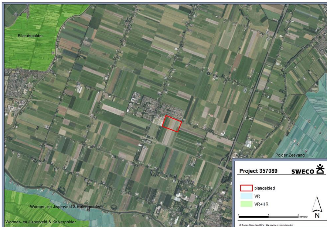
Figuur 3. Ligging van plangebied (rode contour) ten opzichte van Natura 2000-gebieden in de omgeving.

Eilandspolder is open poldergebied aangewezen voor soorten en habitattypen aangewezen onder de Vogelrichtlijn en Habitatrichtlijn. Het is een hoogveengebied dat grotendeel bestaat uit graslanden op veen en verlandingsvegetaties. Met name voor Noordse woelmuis en Smient, Goudplevier en Grutto is het gebied van belang als leef- en rustgebied.