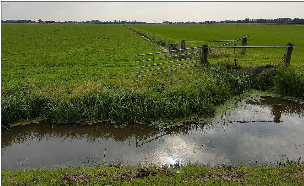
figuur 2. Impressie plangebied, gezien vanaf de Rijperweg in zuidelijke richting.

Het plangebied is 21 hectare groot en omvat hoofdzakelijk agrarisch grasland en een braakliggend terrein. Het gebied wordt begrensd door de Rijperweg, Hendrick de Keyserweg en de watergang Beetsersloot. Het braakliggend terrein betreft een voormalig boerenerf waar recent de opstallen van zijn gesloopt. Hier liggen enkele grondhopen, verder is het gebied geheel vlak. De rest van het gebied bestaat uit vrij intensief gebruikte graslanden, waar tijdens het veldbezoek schapen graasden. De percelen zijn begrensd met sloten. Deze perceelsloten laten een wisselende mate van begroeiing zien. Soms loopt het gras door tot het water, andere oeverdelen zijn met ruigte, riet of andere oeverplanten begroeid. Aan de westzijde wordt het plangebied begrensd door de wat bredere Beetsersloot. Het plangebied zal in de toekomst gebouwd gaan worden met 45 woningen, zowel rijwoningen als twee-onder-een-kap- en vrijstaande woningen.