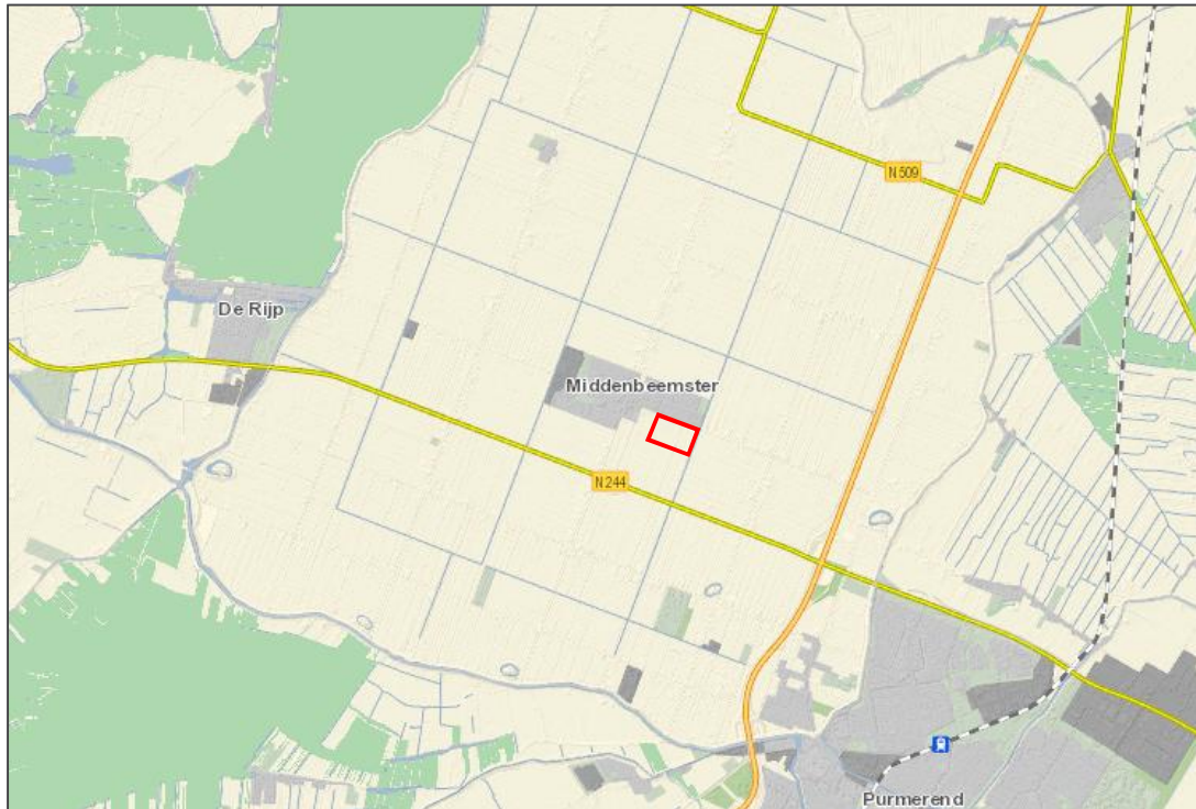
figuur 5. Ligging NNN-gebied (groene vlakken) t.o.v. het plangebied (rode contour).

Externe werking ten aanzien van NNN is in de Provincie Noord-Holland niet van toepassing. Een nee-tenzij-toets in het kader van NNN is niet noodzakelijk.