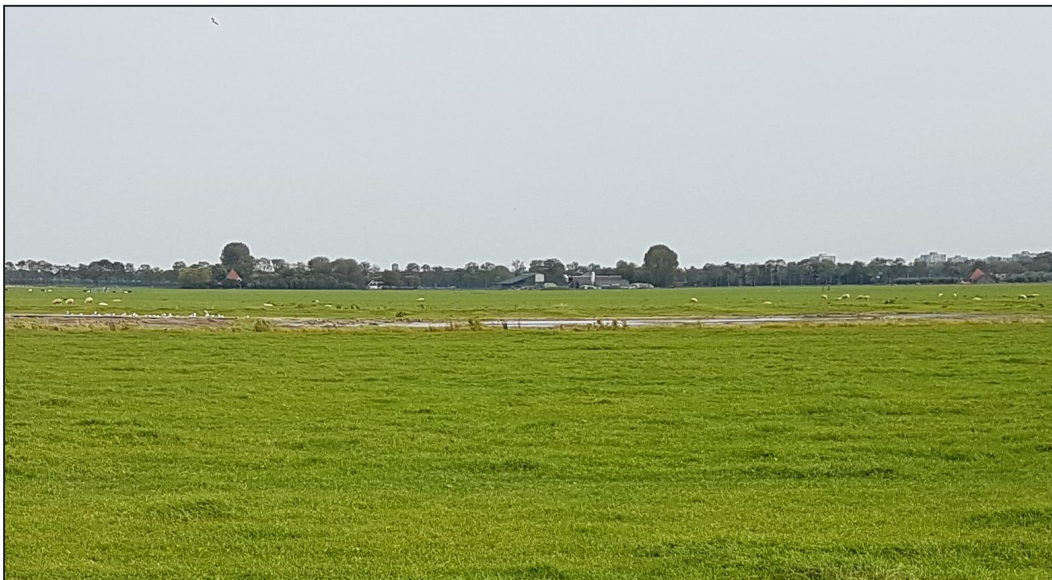
figuur 4. Grasland in plangebied met natte laagte.

Wel kunnen algemene vrijgestelde soorten voorkomen. Ze werden tijdens het verkennend bezoek verschillende bastaardkikkers werden waargenomen in de sloot langs de Hendrick de Keyserweg. Ook kan kleine watersalamander, gewone pad en bruine kikker worden verwacht in de wateren. Voor deze soorten geldt vrijstelling ruimtelijke ontwikkeling