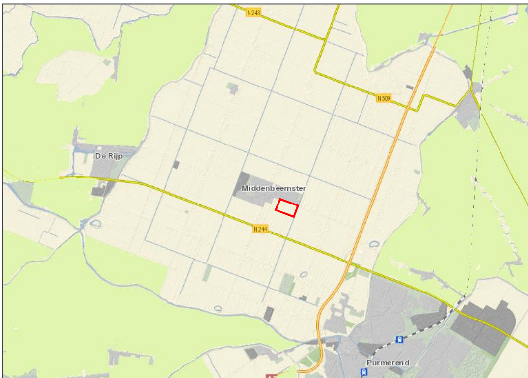
figuur 6. Ligging weidvogelleefgebied (groene vlakken) t.o.v. het plangebied (rode contour).

Externe werking ten aanzien van de weidevogelleefgebieden is niet van toepassing, derhalve is een nadere toetsing niet nodig.