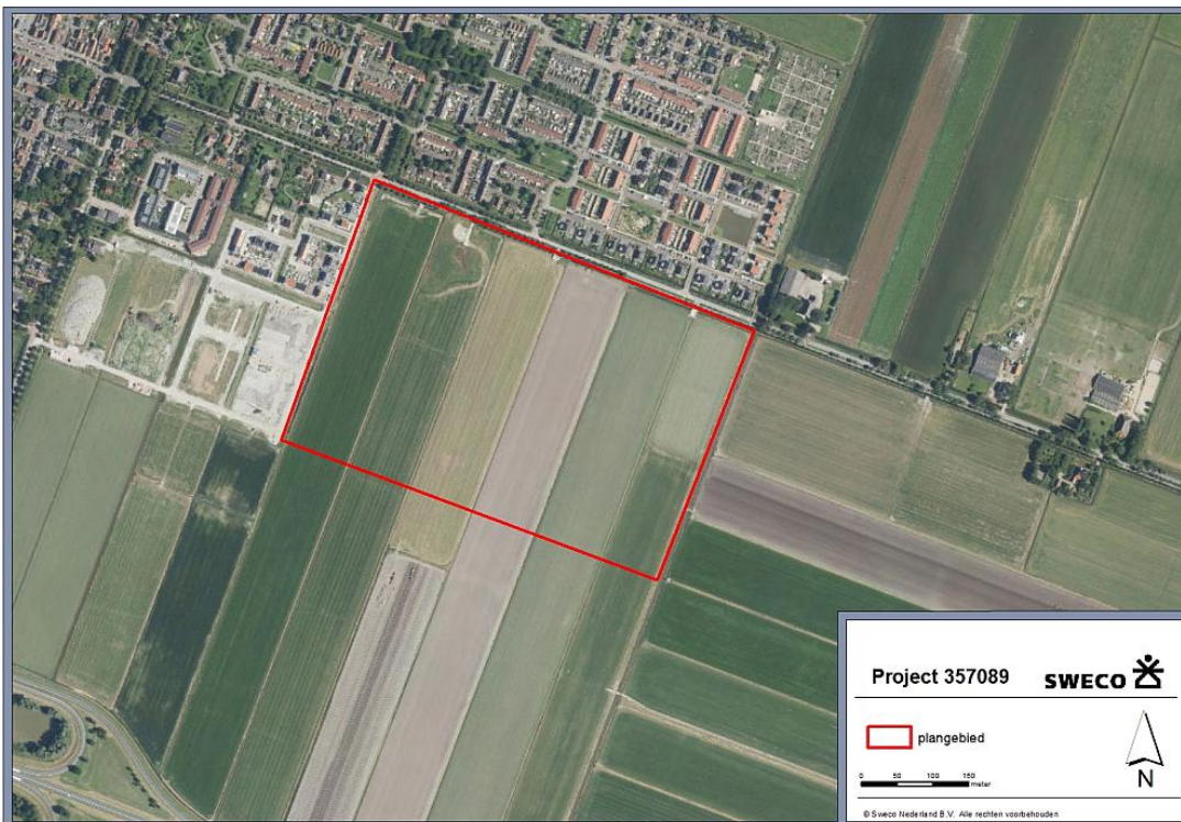
Figuur 1. Begrenzing plangebied (rode contour) De Keyser fase II, Middenbeemster.

Voor het realiseren van de tweede fase van de uitbreidingswijk De Keyser te Middenbeemster, gemeente Beemster, dient een bestemmingsplan te worden opgesteld. Hiertoe dient een verkennend natuuronderzoek uitgevoerd te worden om in beeld te brengen welke beschermde natuurwaarden mogelijk voor kunnen komen. Voorliggende rapportage brengt de effecten in beeld die de ontwikkelingen kunnen hebben op beschermde soorten en gebieden. Het achterliggende onderzoek bestaat uit een oriënterend veldonderzoek en bronnenonderzoek.