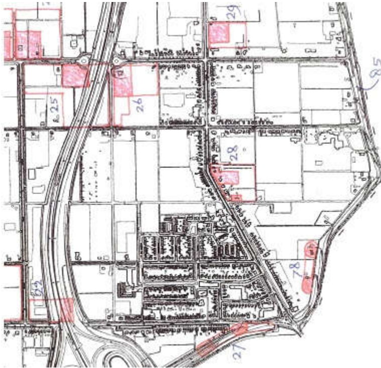
Figuur 5.1 Uitsnede archeologiekaart