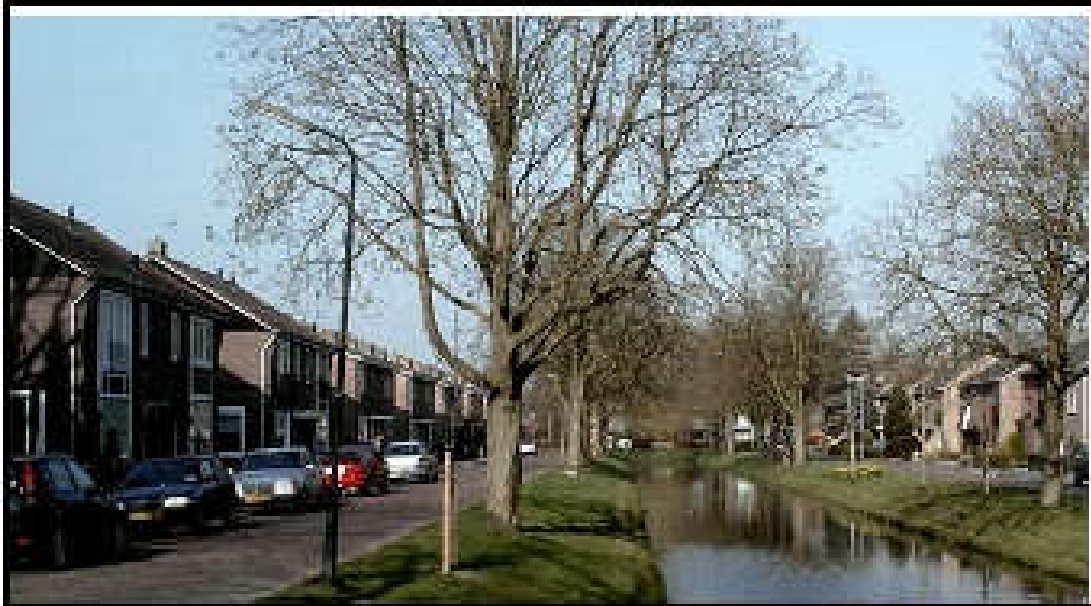
Figuur 3.2 Impressie buurten (Prinses Wilhelminasingel)

In figuur 3.2 is een impressie van de inrichting van een buurt weergegeven.