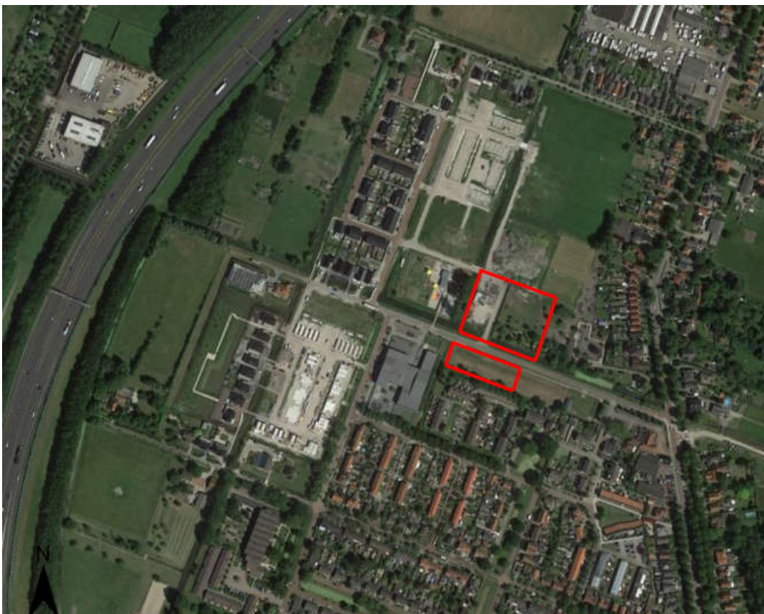
Figuur 1.1: Ligging plangebied

Het plangebied ligt ten noorden van de kern Zuidoostbeemster in de gemeente Beemster, en vormt het laatste deelplan binnen het project De Nieuwe Tuinderij - west. Het plangebied kent twee deelgebieden. Het noordelijke deelgebied grenst aan de zuidzijde aan het Middenpad en aan de noordzijde aan het te ontwikkelen plandeel 'Appels en perenpad' waarvan het bestemmingsplan is vastgesteld. Fase 1, 2, 3 en 4 zijn voltooid, fase 5 is in aanbouw. Aan de oostzijde grenst het plan aan het plandeel 'Appels en perenpad' en zijn, op enige afstand, de bestaande woningen aan de Purmerenderweg gesitueerd. Het zuidelijk deelgebied ligt tussen het Middenpad en de Van der Hoekstraat en de Ninaberstraat. Aan de westzijde grenst het plan aan speeltuin De Spelemei en het Multifunctioneel Centrum De Boomgaard.