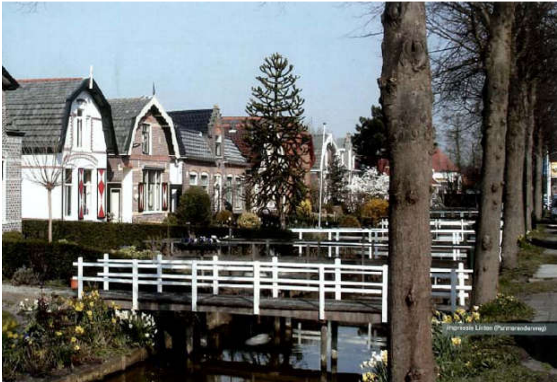
Figuur 3.1 Impressie lintbebouwing (Purmerenderweg)

In figuur 3.1 is een impressie van de inrichting van lintbebouwing weergegeven.