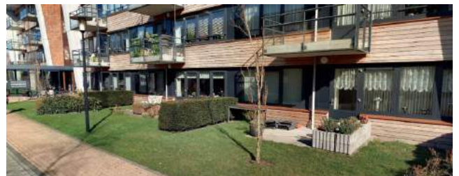
referentie voor de overgang buitenruimte en park