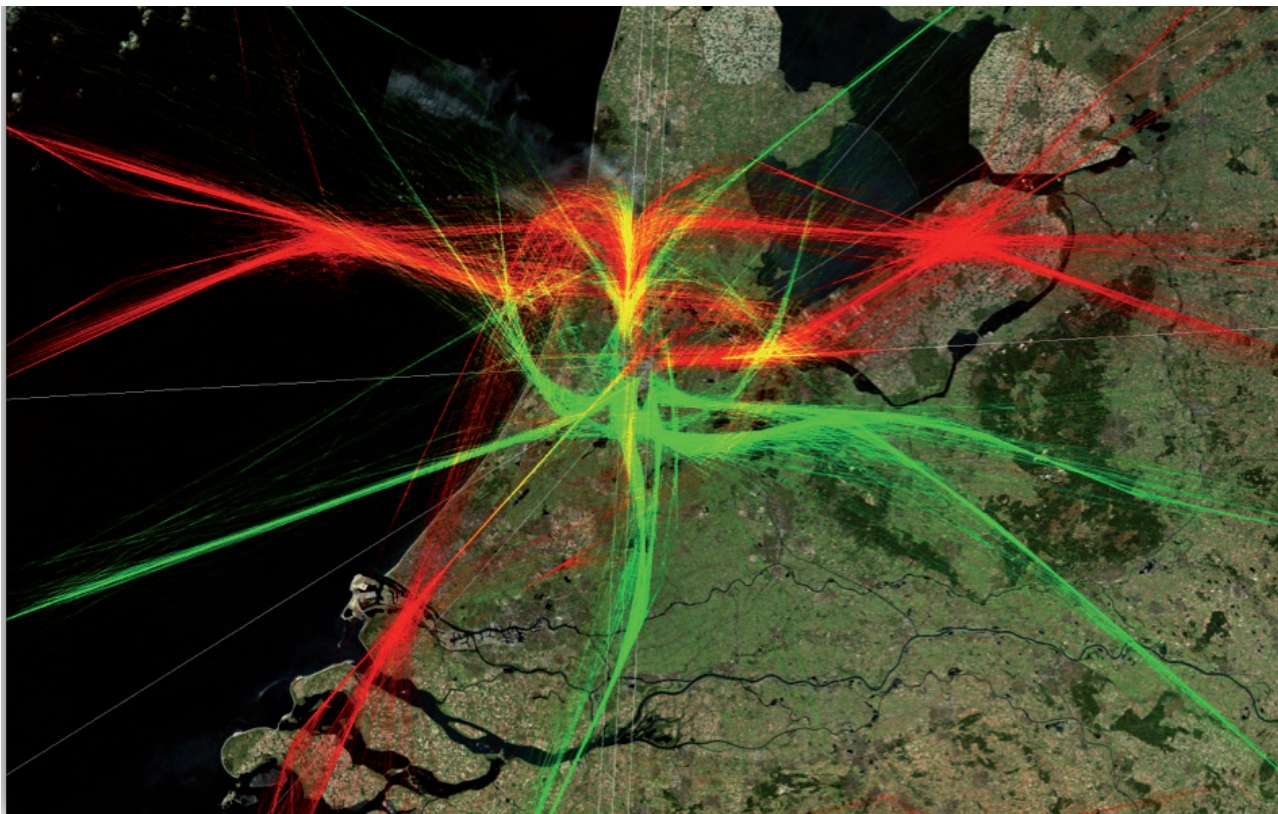
'air corridors Amsterdam'

Een gemeente is ervoor om die zaken te regelen die inwoners niet alleen of in collectief verband zelf kunnen. Dat betekent dat er van een gemeente mag worden verwacht dat hij een toegevoegde waarde biedt aan de samenleving die zij dient. Om te kunnen beoordelen of er sprake is van een toegevoegde waarde en of die toegevoegde waarde voldoende groot is, zal moeten worden waargenomen welke onderwerpen in de samenleving 'ertoe doen'. Vervolgens kan de inzet van de overheid ernaast worden gezet en worden beoordeeld of er wellicht meer mogelijk is. Kortom: de inhoud is vertrekpunt bij de vorm die de regio kiest.