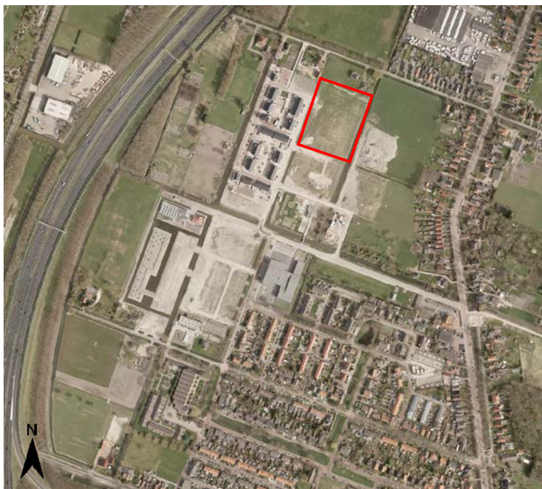
Figuur 1.1: Ligging plangebied

Het plangebied ligt ten noorden van de kern Zuidoostbeemster, in de gemeente Beemster. Het plangebied wordt aan de noordzijde begrensd door het enkele kavels aan het Noorderpad en ten westen aan de gerealiseerde 42 woningen van plandeel De Nieuwe Tuinderij. Ten zuiden en oosten grenst het plangebied aan grasland.