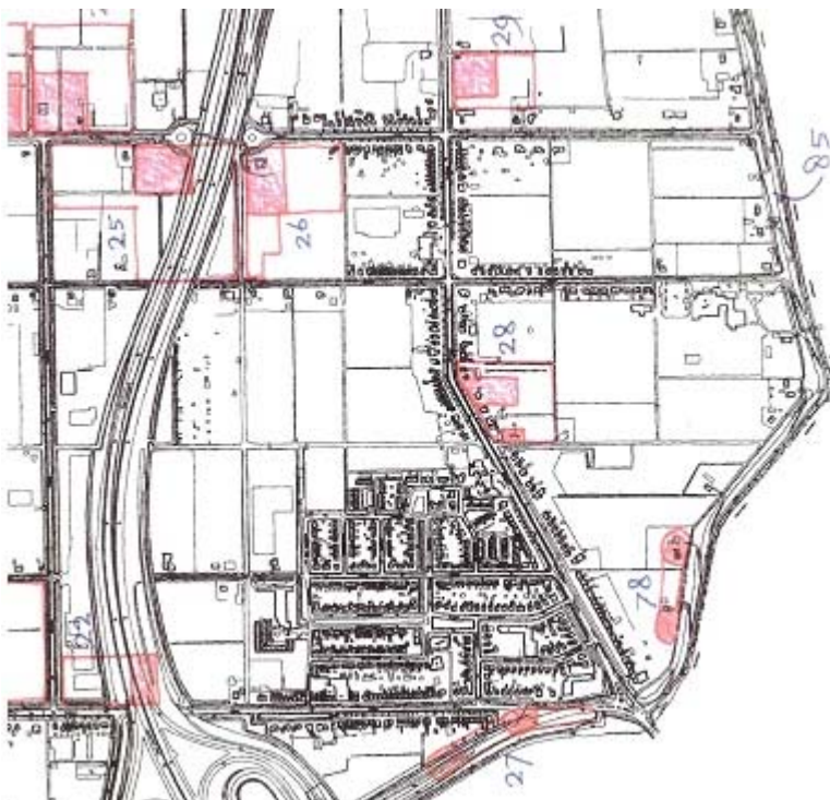
Figuur 5.1 Uitsnede archeologiekaart bladzijde 3

Geconcludeerd wordt dat in de gronden van het onderhavige plangebied geen archeologische waarden worden verwacht. In de archeologienota is een archeologieregime voor het "overig grondgebied" opgenomen. Gelet op de lage trefkans is het opnemen van een regime voor het "overig grondgebied" door de gemeenteraad niet van toepassing verklaard. Dit zou namelijk onnodig kosten met zich meebrengen voor aanvrager en gemeente, aangezien hierdoor een archeologisch onderzoek verplicht zou worden terwijl de trefkans laag is. Het aspect archeologie vormt geen belemmering voor de voorgenomen woningbouw binnen het plangebied van dit bestemmingsplan.