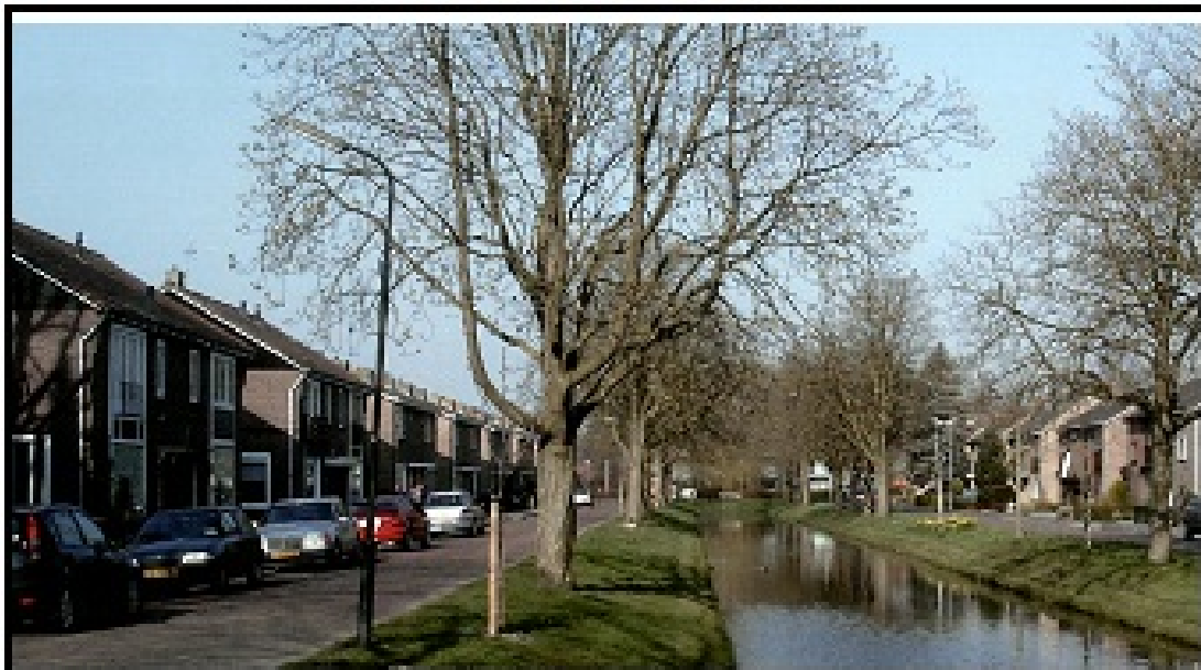
Figuur 2.2 Impressie buurten (Prinses Wilhelminasingel)

In figuur 2.2 is een impressie van de inrichting van een buurt weergegeven.