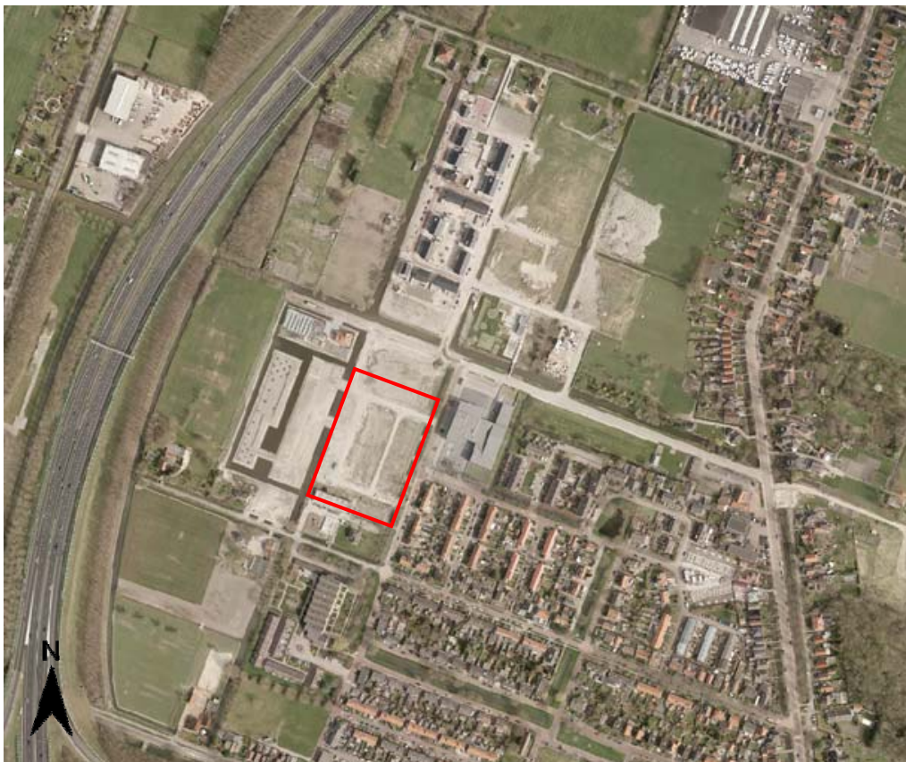
Figuur 1.1: Ligging plangebied

Het plangebied ligt aan de westzijde van Zuidoostbeemster, in de gemeente Beemster. Het plangebied wordt aan de noordzijde begrensd door het verlengde Middenpad en de gerealiseerde 42 woningen van het deelplan De Nieuwe Tuinderij. Aan de zuidzijde wordt het plan begrensd door twee woningen aan het Zuiderpad. Ten westen wordt het plangebied begrensd door een waterloop met achtergelegen gronden waar op korte termijn woningbouw gaat plaatsvinden op basis van het onherroepelijke bestemmingsplan 'Locatie Kwekerij Slot'. Tot slot wordt het gebied aan de oostzijde begrensd door de waterloop gelegen aan de Hendrik Wagemakerstraat.