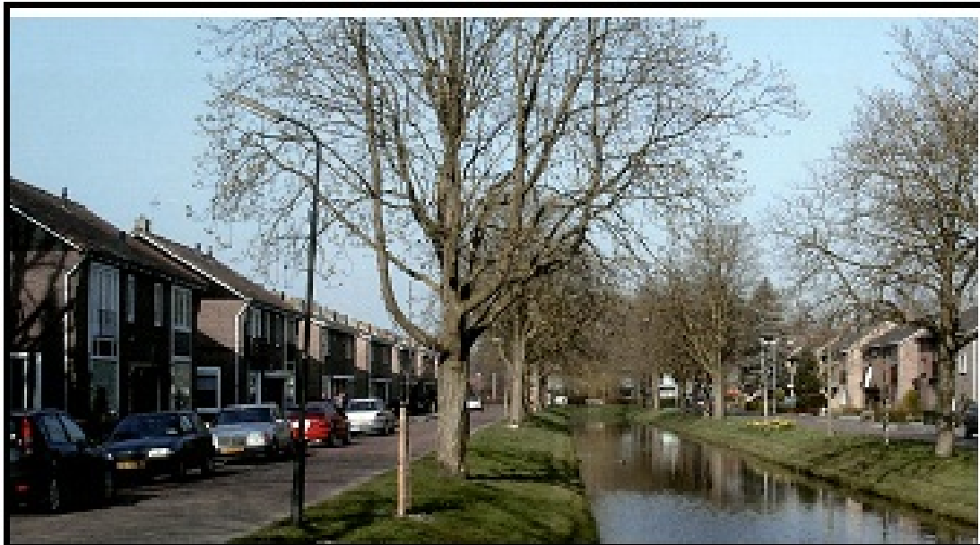
Figuur 2.2 Impressie buurten (Prinses Wilhelminasingel)

In figuur 2.2 is een impressie van de inrichting van een buurt weergegeven.