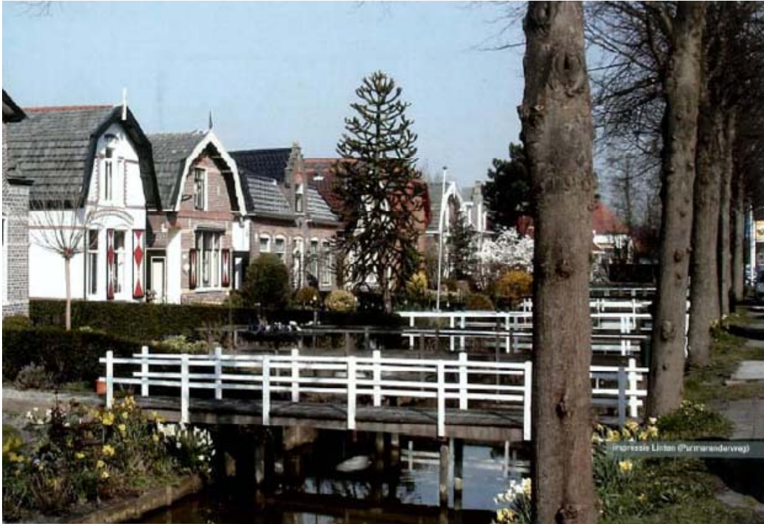
Figuur 3.1 Impressie lintbebouwing (Purmerenderweg)