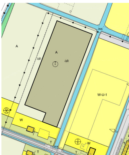
Figuur 1.2 Uitsnede Bestemmingsplan Zuidoostbeemster I

Het vigerende bestemmingsplan van de gemeente Beemster is het bestemmingsplan Zuidoostbeemster I dat op 18 december (gewijzigd) is vastgesteld door de gemeenteraad van Beemster en op 9 juli 2009 is goedgekeurd door Gedeputeerde Staten van de provincie Noord-Holland. In dit bestemmingsplan hebben de gronden de bestemming “Agrarisch – Glastuinbouw”, “Wonen” en “Tuin”. De voorgenomen ontwikkeling past niet binnen deze bestemmingen. Er is woningbouw voorzien binnen de bestemming “Agrarisch – Glastuinbouw”. Daarnaast zijn de woningen en groentewinkel in het zuiden van het plangebied niet passend binnen de bestemmingen “Wonen” en “Tuin”.