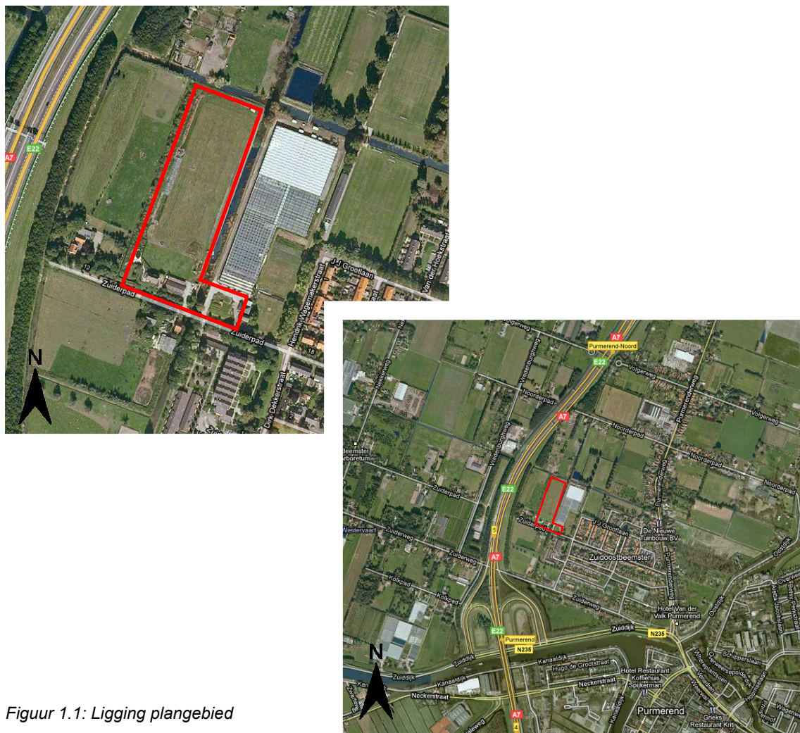
Figuur 1.1: Ligging plangebied

Het plangebied is gelegen ten westen van de kern Zuidoostbeemster in de gemeente Beemster.