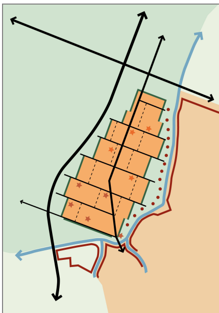
Figuur 5.1 Concept Zuidoostbeemster (linten, buurten en groene randen)

Het stedenbouwkundig plan op de locatie Slot sluit in structuur aan op het plan voor de aangrenzende wijk De Nieuwe Tuinderij. Locatie Slot wordt daarbij opgenomen in de zogenaamde groene randzone zoals deze, conform het concept voor Zuidoostbeemster, ook aan de oostzijde tegen de Ringdijk is geschetst (bron: stedenbouwkundig plan De Nieuwe Tuinderij, SVP augustus 2007).