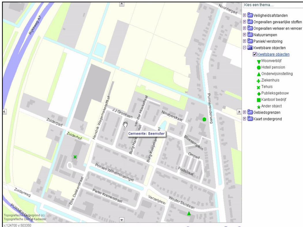
Figuur 4.1: Fragment risicokaart

Link: http://geo.noord-holland.nl/risicokaartpub/start_risicokaart.html