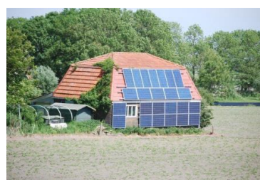
Foto's uit de Beemster, mei 2014: plaatsing zonnepanelen zonder veel aandacht voor beeldkwaliteit