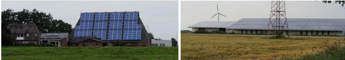
Losse panelen op een boerderijdak in Duitsland en een aaneengesloten panelen op het dak van een Duitse stal (beide foto's uit Sinnestroom, Atelier Fryslân)

Wanneer de zonnepanelen op verharding worden geplaatst, met rekening worden gehouden met watercompensatie-eisen van het hoogheemraadschap. Uit waterhuishoudkundig oogpunt gaat de voorkeur uit naar plaatsing op halfverharding, worteldoek of een andere ondergrond die hemelwater direct naar het grondwater laat vloeien.