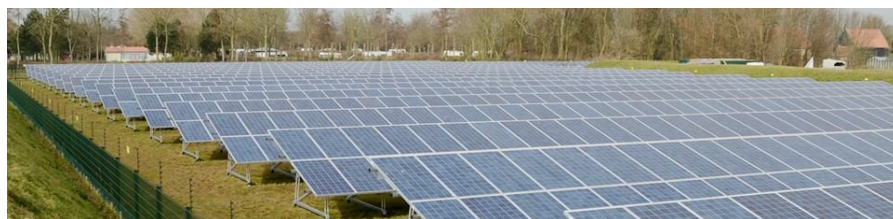
Zonnepark Ouddorp

* onderdeel van Ecopark Waalwijk, oppervlakte betreft alleen het zonnepark