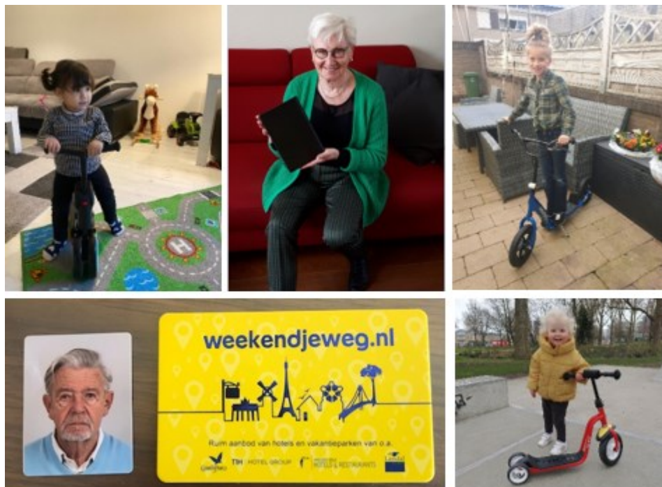
Foto: Een aantal van onze prijswinnaars met hun gewonnen step, tablet en weekendjeweg-bon.