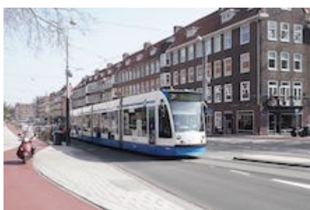
Heemstedestraat flink opgeknapt