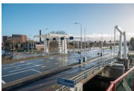
Aanpassingen ontwerp nieuwe duurzame Cruquiusbrug (N201)