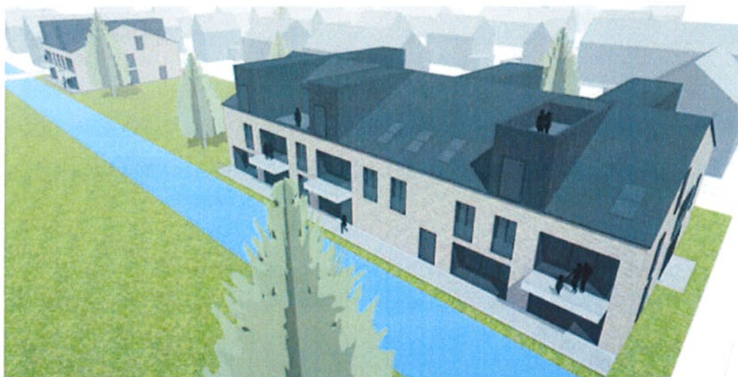
Artist impression van het bouwplan