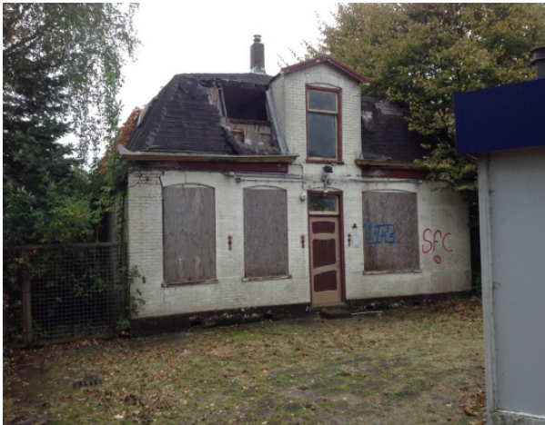
Voormalige bedrijfswoning tankstation Noordbeemster

Afhankelijk van de aard en ernst van de overtredings situatie wordt de overtreder gewaarschuwd of wordt er direct bestuursrechtelijk en/of strafrechtelijk opgetreden. De bestuursrechtelijke handhaving vindt plaats conform de nalevingsstrategie van de nota VTH. Vanuit de veranderende omgeving wordt een vernieuwde aanpak verwacht waarbij gekeken wordt naar oplossingsrichtingen. Dit zie je bijvoorbeeld terug bij illegale bouwactiviteiten waarbij de belangen van alle betrokkenen een plaats moeten krijgen. Dat is niet alleen complex maar ook tijdrovend.