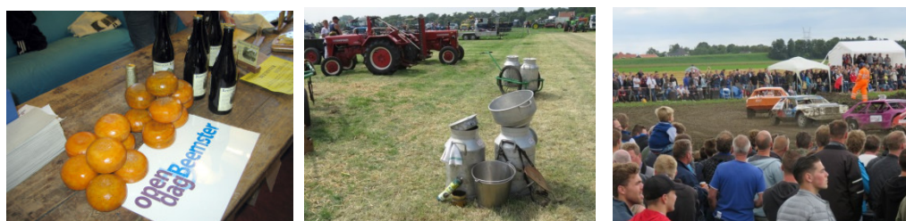
Voorbeelden van evenementen in de Beemster