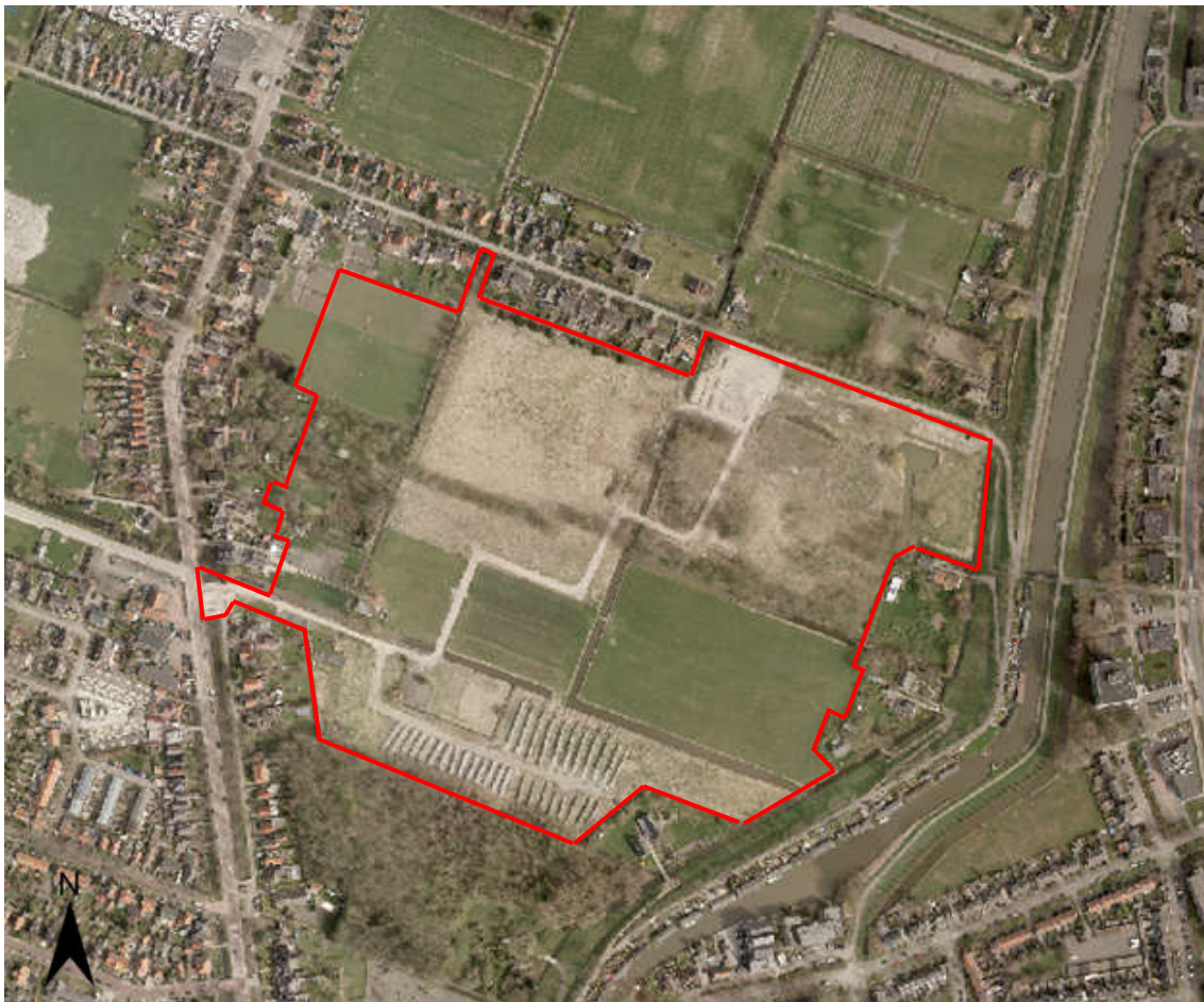
Figuur 1.1: Ligging plangebied

Het plangebied ligt ten noordoosten van de kern Zuidooftbeemster in de gemeente Beemster, ten zuiden van het Noorderpad, ten noorden van het Reigerbos, ten oosten van de Purmerenderweg en ten westen van de Oostdijk. In figuur 1.1 is de exacte begrenzing weergegeven.