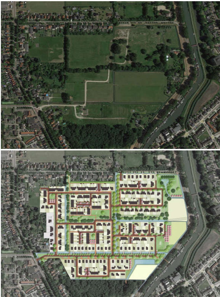
Afbeelding 4: luchtfoto gebied De Nieuwe Tuinderij Oost en stedenbouwkundig plan (SVP)

pad vormt vanaf de Purmerenderweg, net als het Noorder- maar ook het Zuiderpad, een open oostwest-lijn waaraan in de sfeer van de tuinders- en rentenierswoningen, nieuwe woningen zijn gedacht. De twee noordzuid-lopende sloten in het plangebied zijn opgenomen in de hoofdstructuur. Er is hierbij in inrichting een onderscheid gemaakt tussen de sloot midden door het plan, die als hoofdsloot op de historische kaarten staat en de sloot achter de Purmerenderweg, die op de oude kaarten in hierarchie minder zwaar is aangezet. Beide sloten worden in de wijk open groene zones tussen het Noorder- en Middenpad. Maar de hoofdsloot krijgt door openbare taluds met voetpaden langs het water een volledig openbaar karakter in de wijk. En de subsloot wordt aan één zijde openbaar. Beide sloten blijven zichtbaar en herkenbare elementen in de wijk.