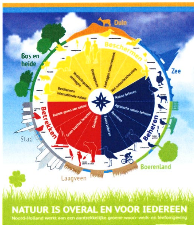
Figuur 1. Groen in één oogopslag

Wij investeren zowel in de kwantiteit als de kwaliteit van de Noord-Hollandse natuur. In Noord-Holland werken wij onverminderd voort aan de afronding van het NNN. Sinds de decentralisatie van het natuurbeleid in 2013 is 2.500 hectare nieuwe NNN gerealiseerd. In totaal is inmiddels zo'n 50.600 hectare gerealiseerd; er resteert nog een opgave van 5.800 hectare. Moeilijker in hectares uit te drukken, maar minstens zo belangrijk, is de verbetering van de natuurkwaliteit in reeds bestaande natuurgebieden. Dit doen wij door het tegengaan van verdroging en de effecten van stikstof- en fosfaatemissies en verbetering van de waterkwaliteit, onder andere via een herstelmaatregelen programma in de Natura 2000-gebieden en door het natuur- en landschapsbeheer te subsidiëren. Het Naardermeer is een mooi voorbeeld van een gebied waar kwantiteit en kwaliteit hand-in-hand gaan. Hier werken wij aan de realisatie van de restantopgave in de 'schil' rond het Naardermeer, waarna het waterpeil in het gehele natuurgebied kan worden verhoogd, hetgeen leidt tot een aanzienlijke verbetering van de natuurkwaliteit. Ook blijven we investeren in de aanleg van natuurbruggen en faunapassages op plaatsen waar infrastructuur een barrière vormt. Een overzicht van onze inspanningen vindt u in de figuur 'Groen in één oogopslag' (fig. 1).