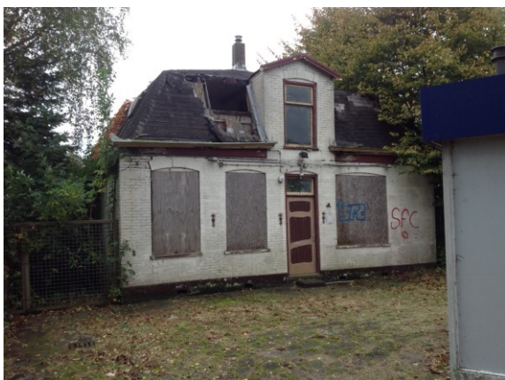
De voormalige bedrijfswoning

Bij een voormalige (bedrijfs)woning bij een tankstation aan de Oosthuizerweg was sprake van verloedering. De woning werd niet meer bewoond en was in slechte staat van onderhoud. Met de eigenaar van de woning is een aantal gesprekken gevoerd. Dit heeft ertoe geleid dat de woning is gesloopt en het terrein is opgeruimd.