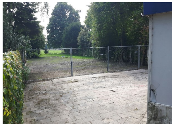
De woning is gesloopt en het terrein geschoond.