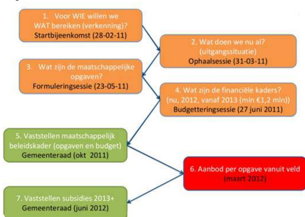
Figuur 9: Proces totstandkoming maatschappelijk beleidskader gemeente Purmerend

Onderstaand figuur geeft een overzicht van het proces van de totstandkoming van het maatschappelijk beleidskader. In onderstaande paragrafen wordt iedere stap beknopt toegelicht.