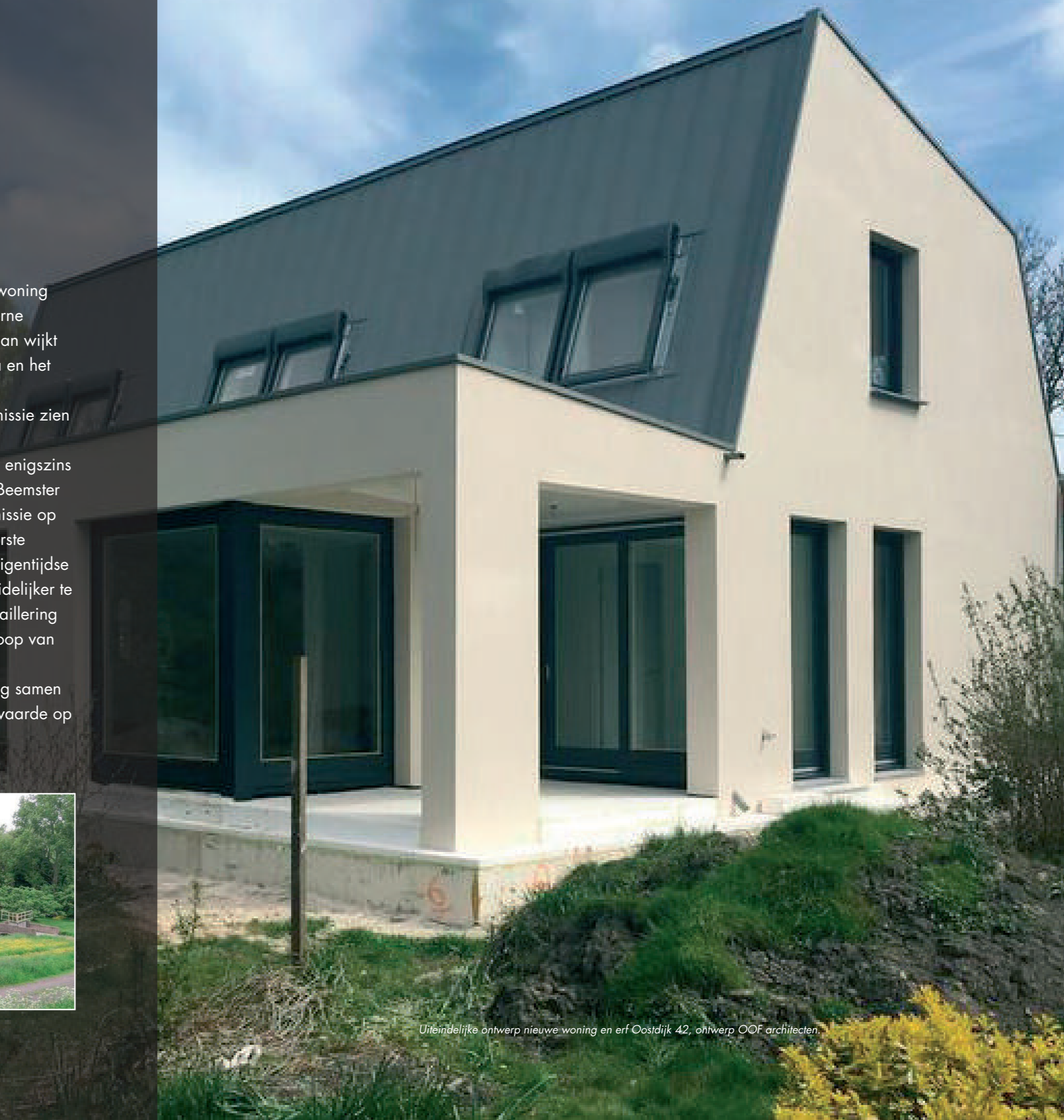
Uiteindelijke ontwerp nieuwe woning en erf Oostdijk 42, ontwerp OOF architecten.