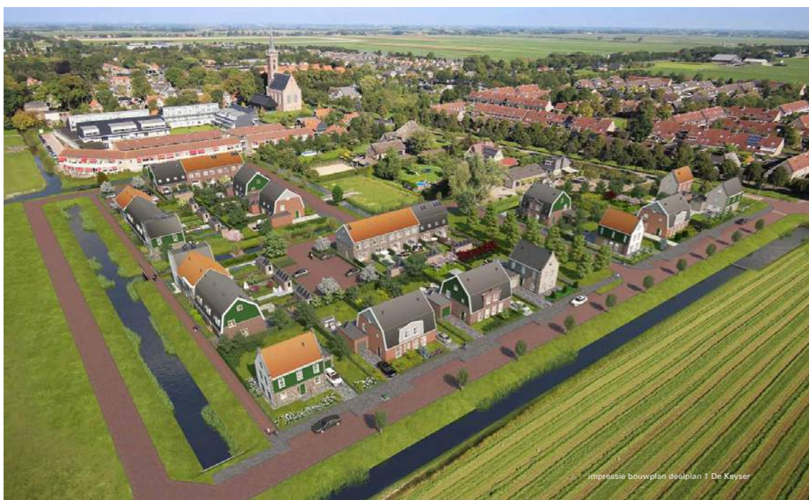
De Keyser deelplan 2