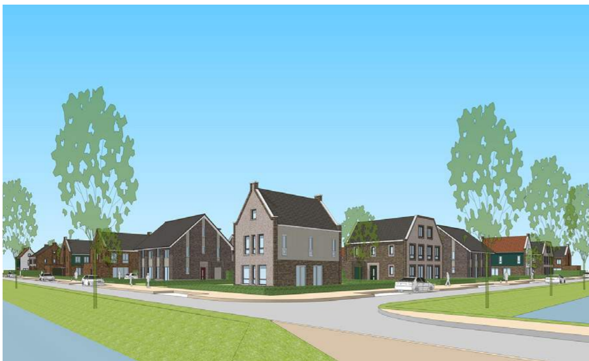
Ontwerp woningen deelplan 2 De Keyser, Middenbeemster