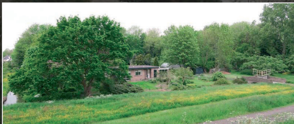
Bestaande woning en erf

Aan de Oostdijk wordt op een prominente plek een nieuwe woning gebouwd met een abstracte dakvorm en voorzien van moderne materialen als wit gestuukte gevels en een zinken dak. Het plan wijkt op belangrijke punten af van het beleid in de omgevingsnota en het bestemmingsplan (nokrichting, eigentijdse materialen, positie bijgebouwen, erfinrichting). Zowel de gemeente als de commissie zien op basis van de eerste schetsen echter kansen voor een kwaliteitsverbetering voor dit erf en deze omgeving. Door de enigszins geïsoleerde ligging achterop het erf en aan de rand van de Beemster waar een divers beeld is, is er naar de mening van de commissie op deze locatie ruimte voor een eigentijdse vormgeving. Het eerste ontwerp hinkt echter nog op twee gedachten en laat zowel eigentijdse als traditionele eigenschappen zien. Gevraagd wordt om duidelijker te kiezen voor een eigentijdse vormgeving en dat ook in de detaillering door te zetten. Het plan wordt hierop aangepast. Door de sloop van twee schuren en het behoud van de fruitbomen heeft ook de erfinrichting aan kwaliteit gewonnen. De integrale benadering samen met ambtenaren en de gemeentelijke previsor heeft tot meerwaarde op deze locatie geleid.