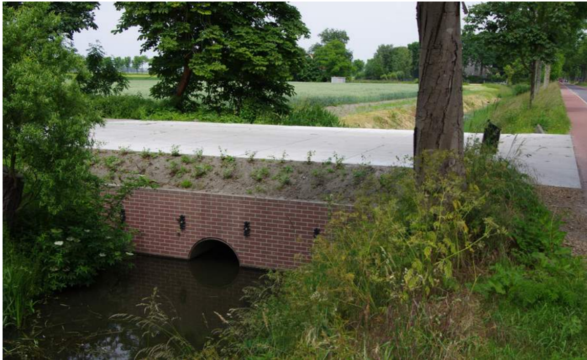
Beleid voor dammen sorteert effect