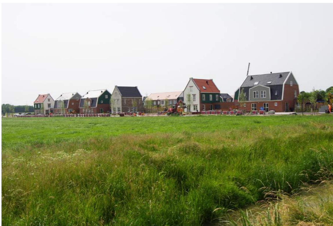
De Keijser deelplan 1, gerealiseerd