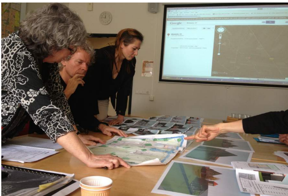
De commissie aan het werk