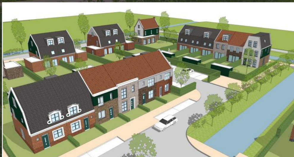
De Keijser, deelplan 1 ontwerp

Bij de beoordeling van de architectuur door de selectiecommissie bleek het beeldkwaliteitplan goed bruikbaar en ook de Welstandscommissie Beemster had heldere kaders voor de toetsing van de uitwerkingsplannen. Hierin heeft de commissie gestuurd op rust en eenvoud passend bij de 'DesBeemsters' inrichtingsprincipes. De commissie is van mening dat het gerealiseerde plan toch een eindbeeld oplevert met een veelheid aan bijzondere details en materialen. In de uitwerking van de volgende fases zal meer worden gestreefd naar heldere eenvoud en samenhang. Desalniettemin is er een aangename woonbuurt ontstaan.