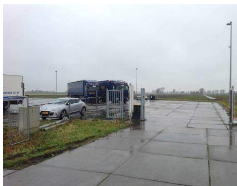
Gebruik in strijd met bestemming