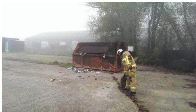
De eigenaar wilde het afval in de container verbranden.

In 2016 wordt aan een aantal onderwerpen extra aandacht besteed. In hoofdstuk 3 wordt dit binnen het programmatisch, het gebiedsgericht en themagericht toezicht verder toegelicht.