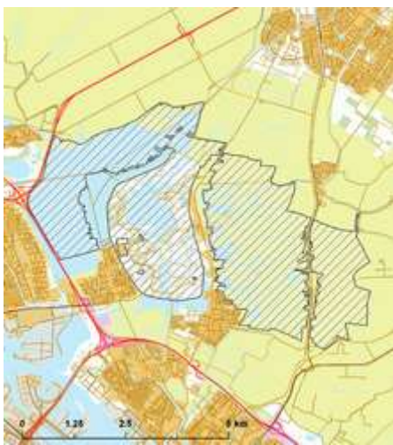
Figuur: Natura 2000 gebied Ilperveld, Varkensland, Oostzaanderveld, Het Twiske

Ilperveld, Varkensland en Twiske kwalificeert zich als Speciale Beschermingszone onder de Vogelrichtlijn vanwege het voorkomen van drempel overschrijdende aantallen van Krakeend, Smient, Kempphaan en Grutto die het gebied benutten als overwinteringsgebied en/of rustplaats. Bovendien behoort het gebied tot één van de vijf belangrijkste broedgebieden voor de Roerdomp in Nederland.