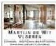
MARTINUS DE WIT VOORDEEN

De Rijp - Gelukt is het te zien, geen laatste verken vanzelfsprekend, maar de laatste verken vanzelfsprekend. De Rijp - Gelukt is het te zien, geen laatste verken vanzelfsprekend, maar de laatste verken vanzelfsprekend.