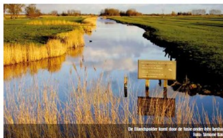
De Eilandspolder komt door de fusie onder één bestuur.

Door de fusie voegt Alkmaar een parel toe aan de cultureel en toeristisch luch al goed ontwikkelde ketting. De activiteiten in onze gemeente passen goed bij de activiteiten in Alkmaar en hier in Graft-De Rijk denken we dat al onze monumenten (er zijn alleen al meer dan 100 rijks-