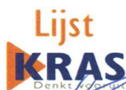
Loek Kras Lijst Kras