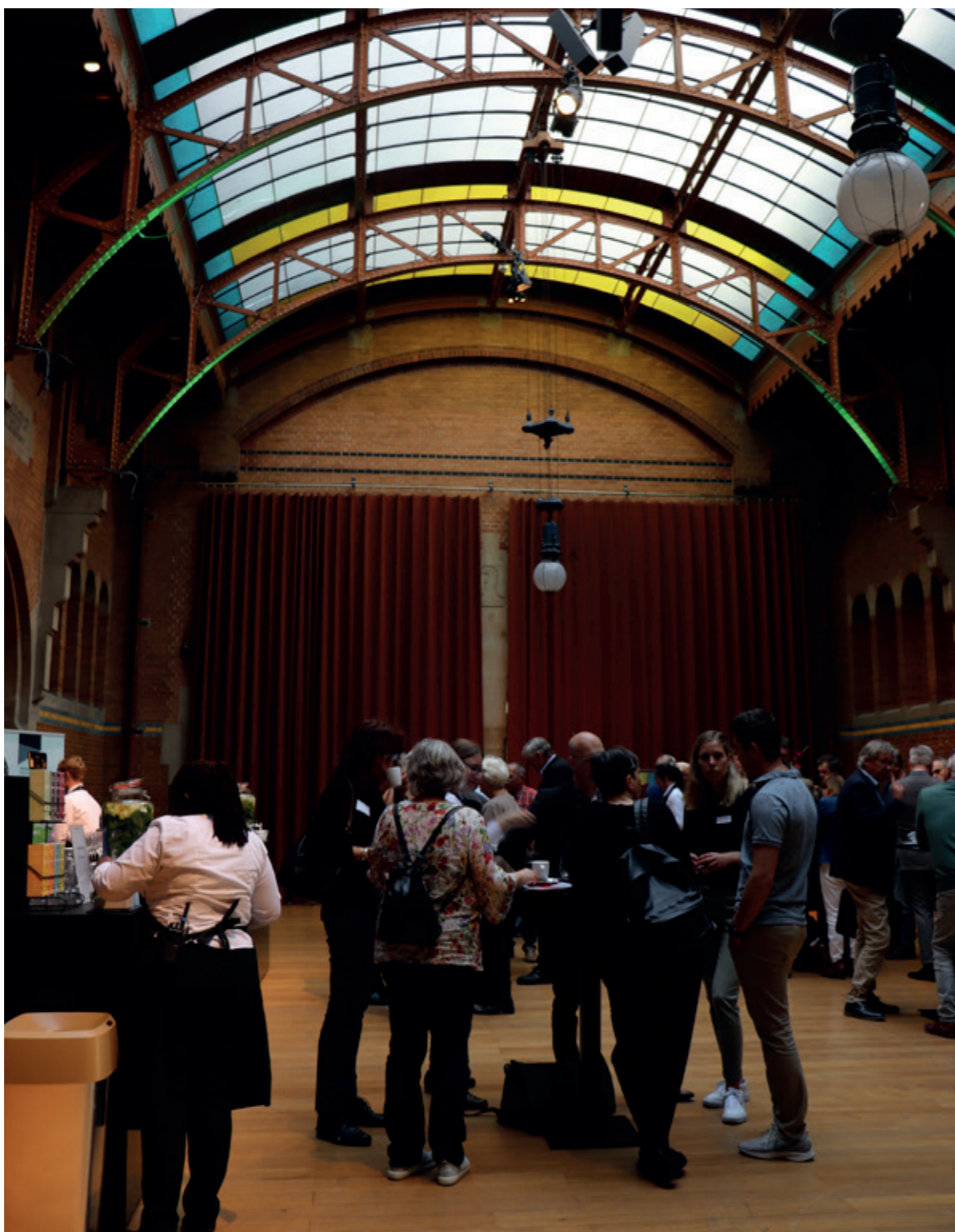
Bijeenkomst Historische verenigingen, gemeenten en de Omgevingswet