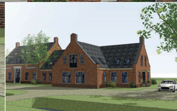
Voorkeursvariant van de aanvrager, Architectenbureau Ruben Wennekers