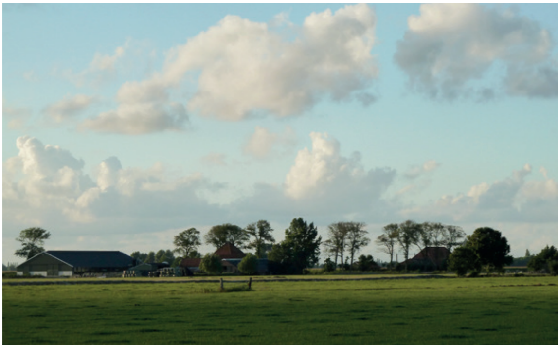
Landelijk gebied Beemster

“Goede omgevingskwaliteit gaat over het belang van aspecten als cultureel erfgoed, architectonische kwaliteit van bouwwerken, stedenbouwkundige kwaliteit en kwaliteit van natuur en landschap. Het gaat daarbij zowel om de menselijke beleving van de fysieke leefomgeving als om de intrinsieke waarden die de maatschappij toekent aan de identiteit van gebieden en aan dier- en plantensoorten.”