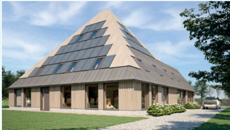
Rechter zijgevel, afbeelding afkomstig van www.barentsz.nl