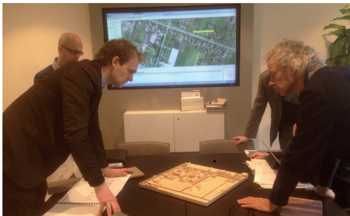
Commissie in overleg