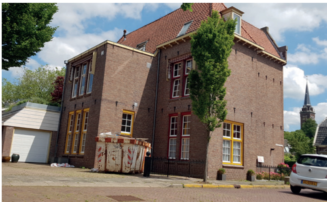
Achterzijde van het voormalige postkantoor. Marcel Heijmans bracht een locatiebezoek en constateerde dat de achterzijde van het pand goed zichtbaar is vanuit de openbare ruimte. Het pand presenteert zich heel duidelijk met de voorzijde naar de Leeghwaterstraat. De achterzijde is secundair. Een topgevel is in deze situatie ongepast.