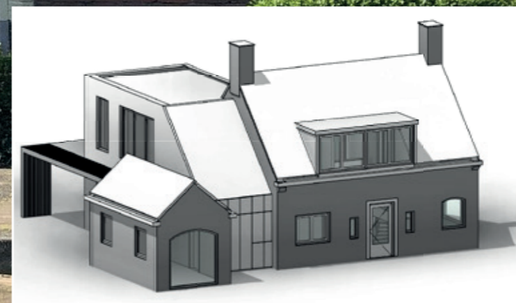
3D aanzicht nieuwe situatie, MakeOver Groep