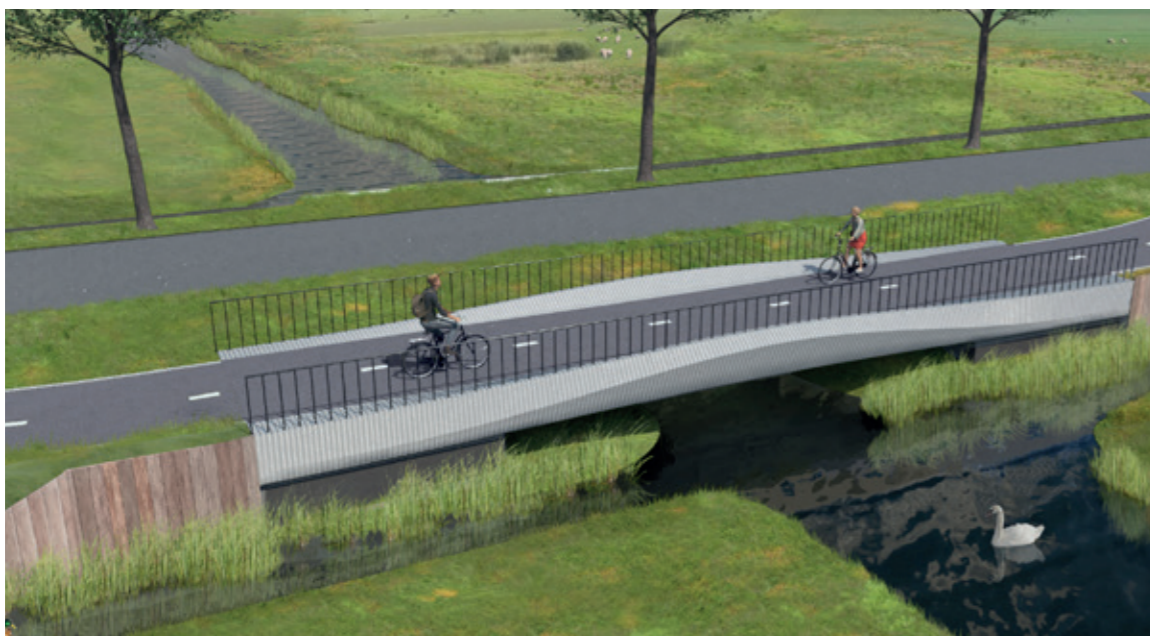
Fietsbrug Vrouwensloot, Witteveen+Bos