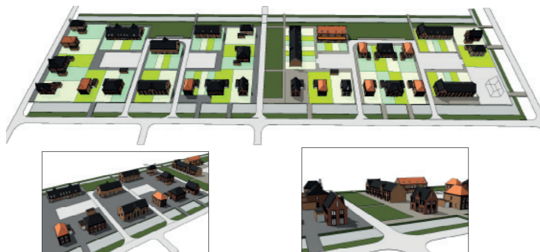
Deelplan 5 De Keyser vogelvlucht stedenbouwkundig plan, Boparai Associates Architecten