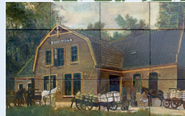
Tegeltableau ter ere van de voormalige kaasfabriek 'De Eendracht'

Een nieuw plan toont het hoofdvolume die zijn karakteristiek behoudt en het naastgelegen pension dat volledig in hout wordt uitgevoerd. De commissie uit haar waardering en spreekt van een duidelijke hiërarchie.