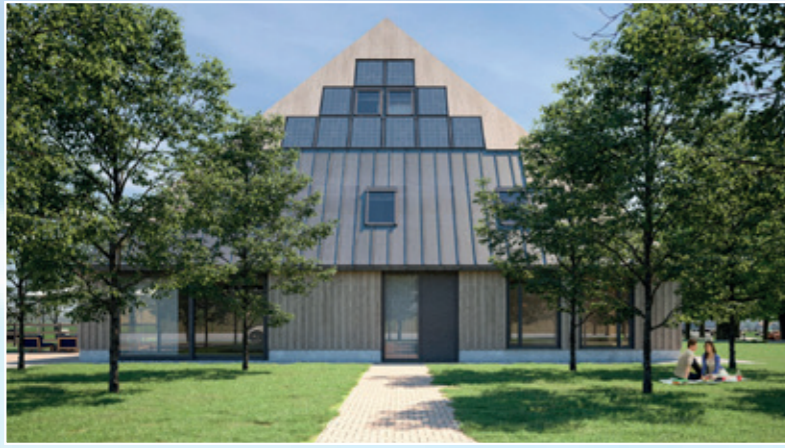
Rechter zijgevel, afbeelding afkomstig van www.barentsz.nl