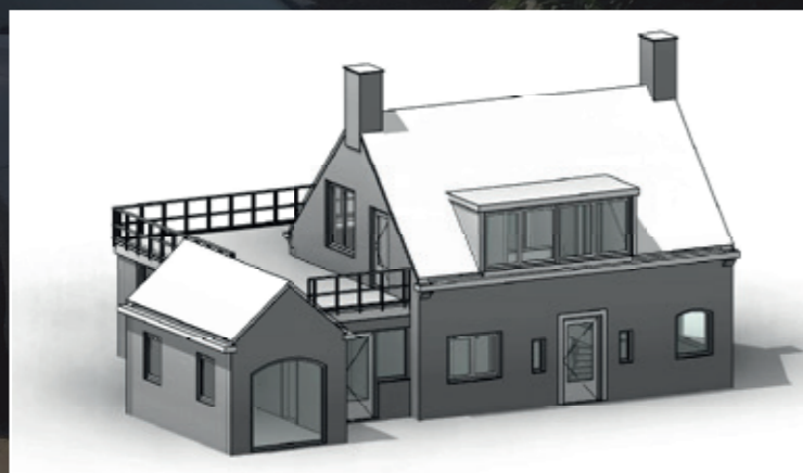
3D aanzicht bestaande situatie, MakeOver Groep

“De commissie wil graag in overleg met de gemeentelijk adviseur en de architect om te komen tot een passende oplossing.”