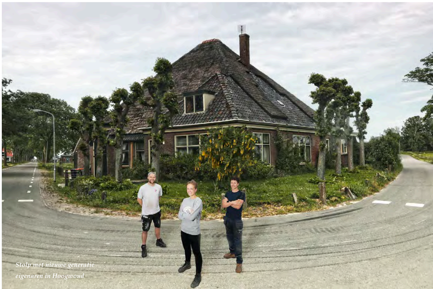
Stolp met nieuwe generatie eigenaren in Hoogwoud.