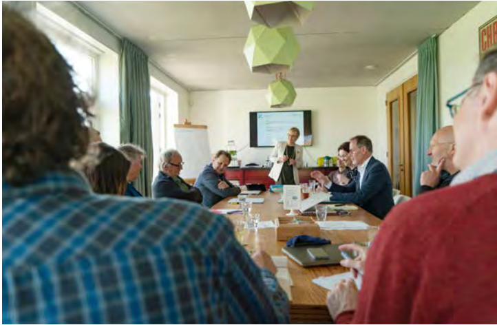
Training communicatie en pr voor bestuursleden, adviseurs en externen.

Noord-Holland in hun collectie boomgaard te Middenbeemster. Want stolp en boomgaard gaan vaak hand in hand.