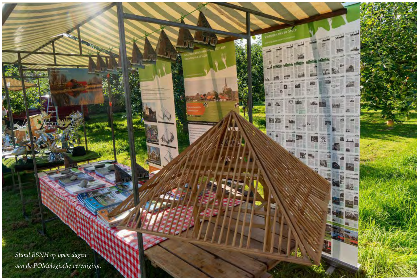
Stand BSNH op open dagen van de POMologische vereniging.