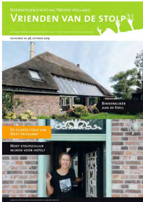
Nieuwsbrief nr. 98