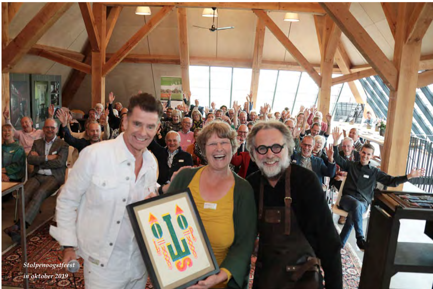
Stolpenoogstfeest in oktober 2019