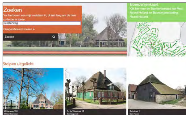
De Beeldbank op boerderijenkaart.nl waar je stolpen kunt zoeken

houderij bij Verlaat en tenslotte een prachtig gerestaureerde stolp met niet vier, maar drie vierkantspalen. Een inspirerende tocht met mooie voorbeelden van herbestemming.