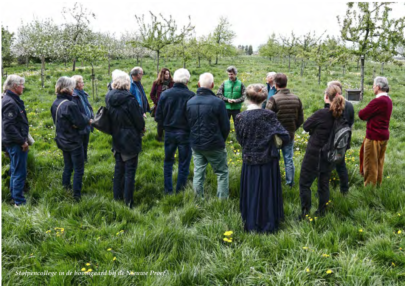
Stolpencollege in de boomgaard bij de Nieuwe Proef