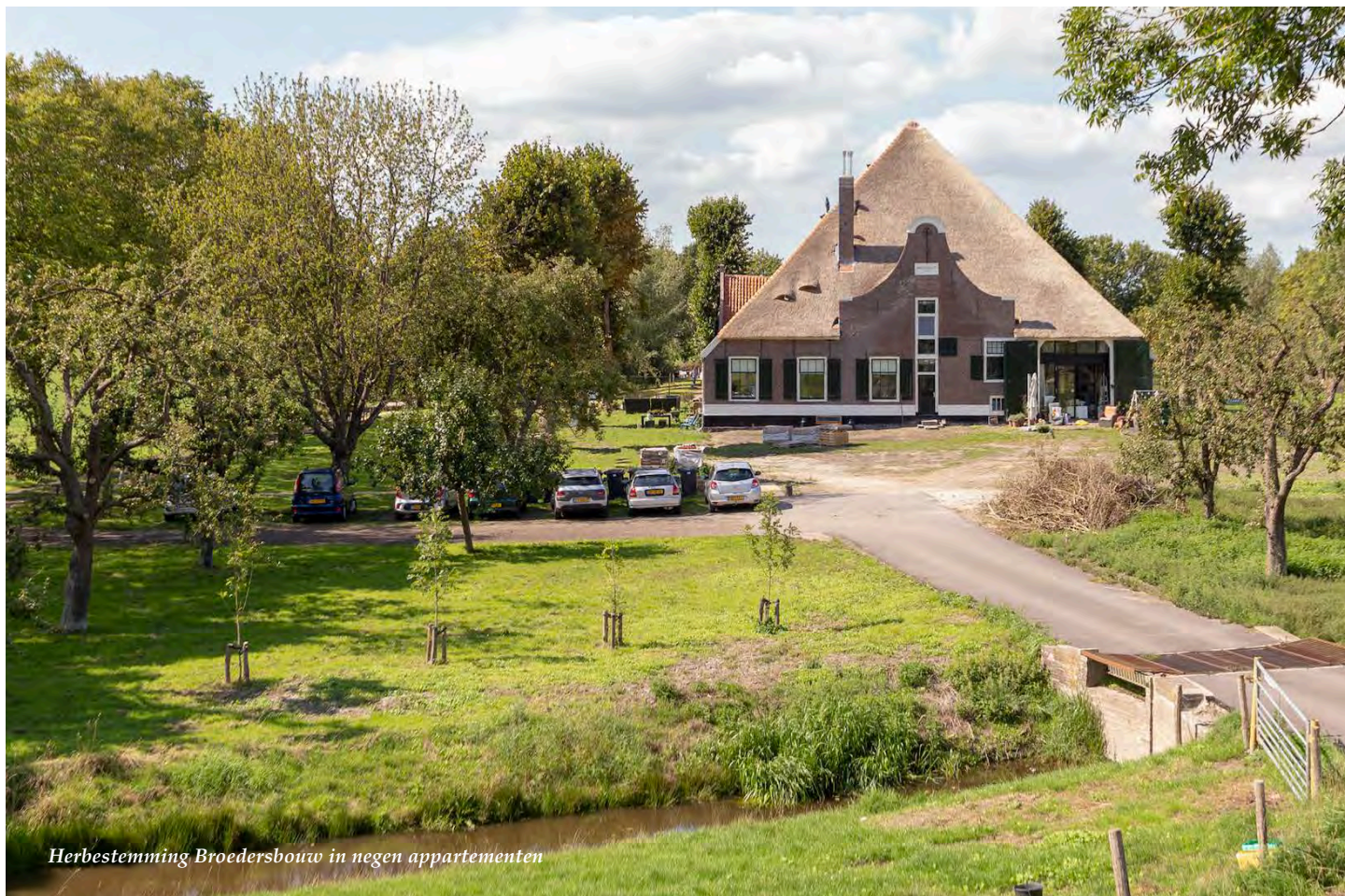
Herbestemming Broedersbouw in negen appartementen