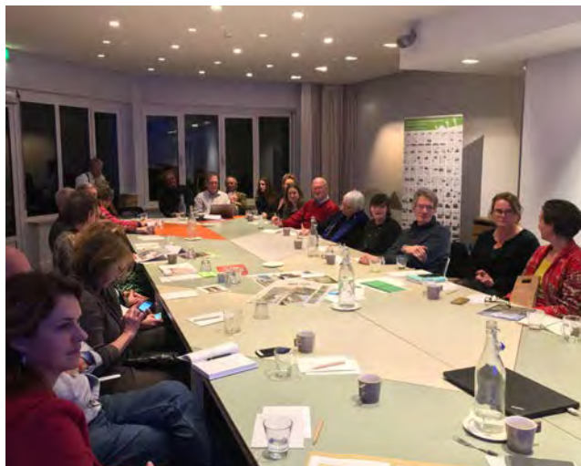
Bijeenkomst bestuur, adviseurs, secretariaat en ambassadeurs en diverse andere stakeholders

Bestuursleden zijn onbezoldigde vrijwilligers. Zij nemen zelf uitvoerende taken op zich en worden daarin ondersteund door het secretariaat of door projectcoördinatoren die tijdelijk op zzp-basis worden ingehuurd.